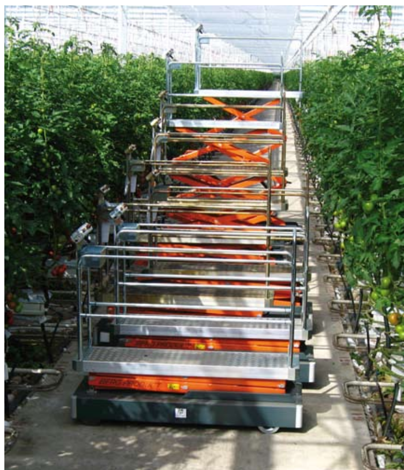
De Benomic electro buisrailwagens van C.G. van Winden BV

Een mooi product en aan te passen aan persoonlijke wensen. De medewerkers van C.G. van Winden zijn er in ieder geval erg blij mee en gebruiken de Benomics alweer een aantal weken naar volle tevredenheid!