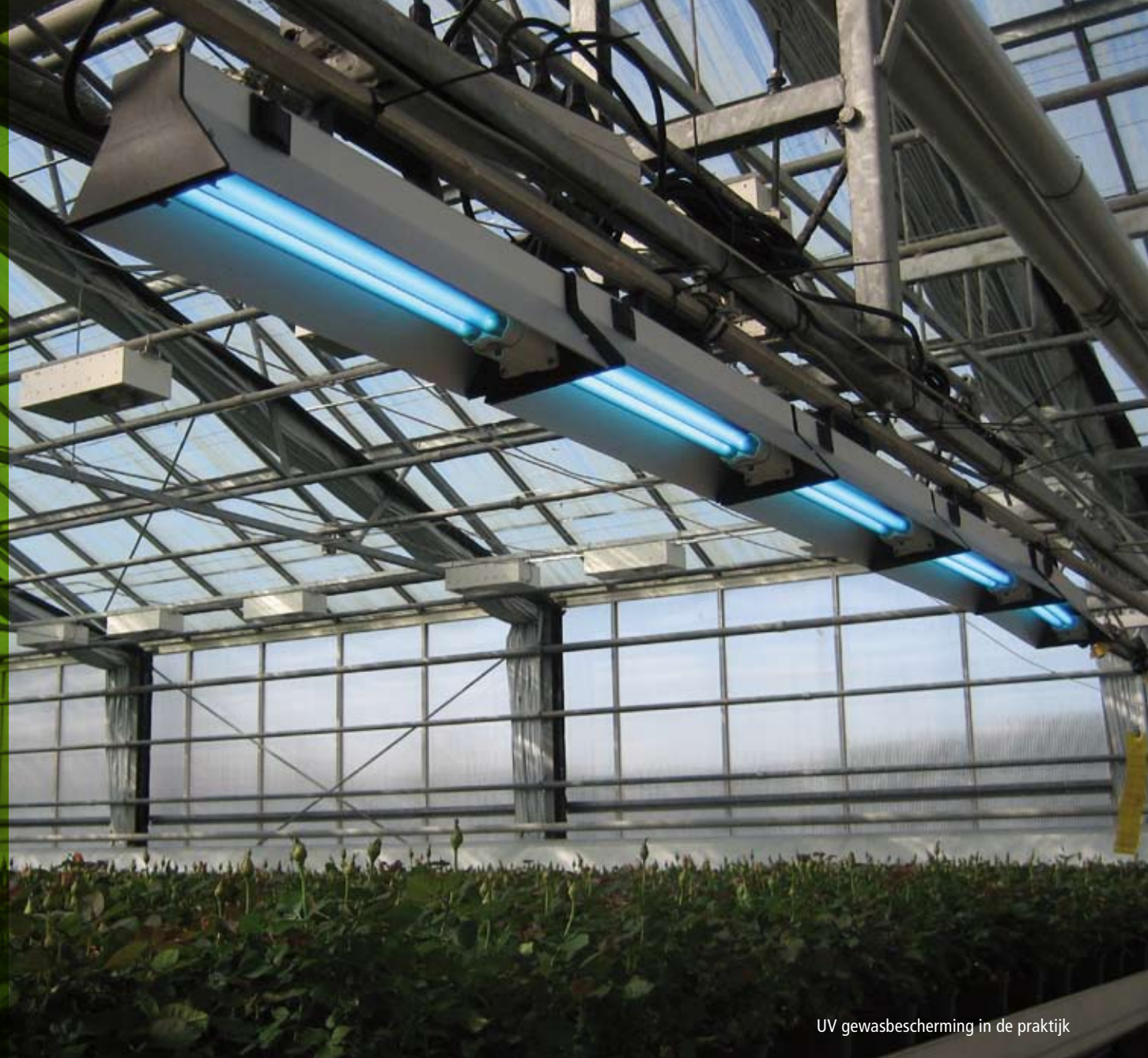
UV gewasbescherming in de praktijk

UV gewasbescherming is een innovatieve techniek die het mogelijk maakt om schimmels, bacteriën en virussen te bestrijden op veel belangrijke landbouwgewassen, en dit alles zonder chemicaliën. De kostenbesparingen voor de kweker alsmede de volksgezondheidsvoordelen voor de consument spreken voor zich. Bijkomend voordeel is dat UV-C licht ook ingezet kan worden voor het ontsmetten van diverse materialen. Denkt u bijvoorbeeld eens aan de kragen van Piko Plant waar wij in onze vorige editie al over vertelden.