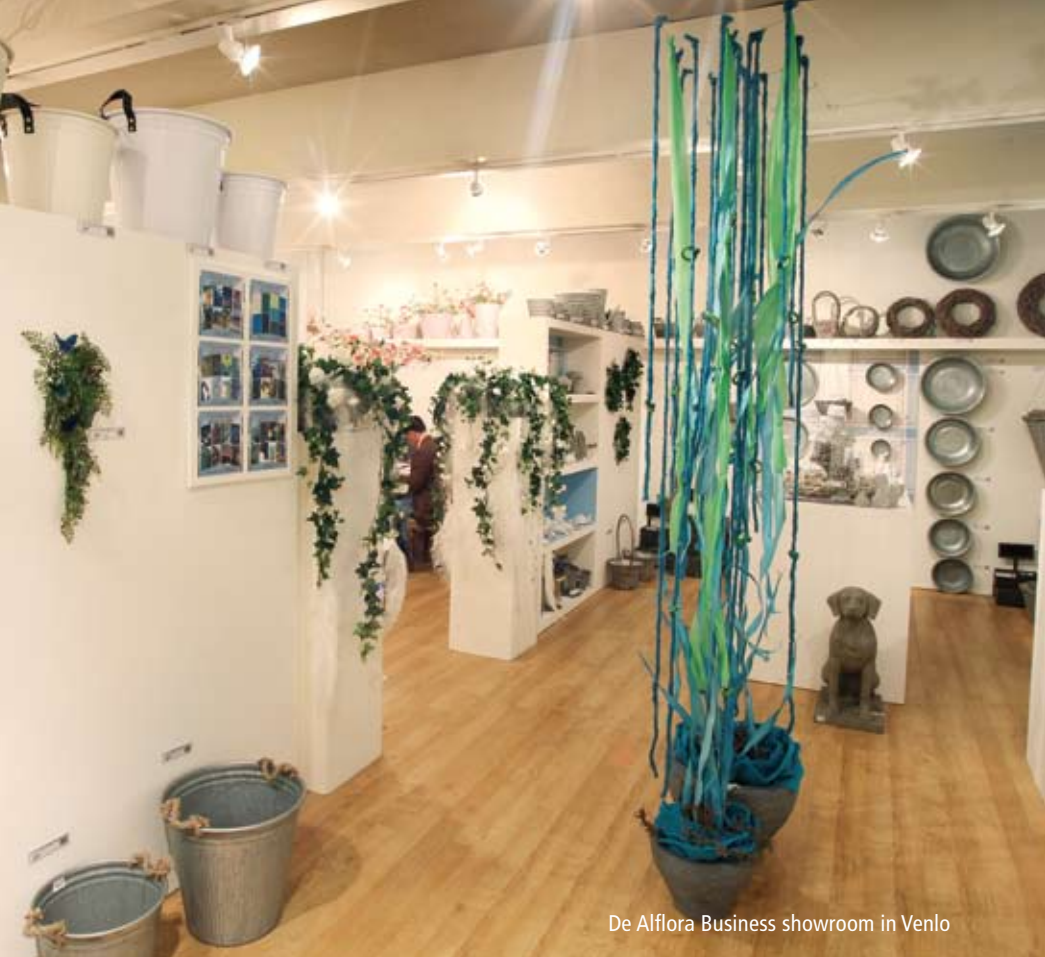
De Alflora Business showroom in Venlo