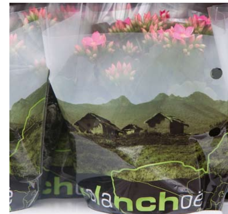
Het opvallende product van Spectraplant