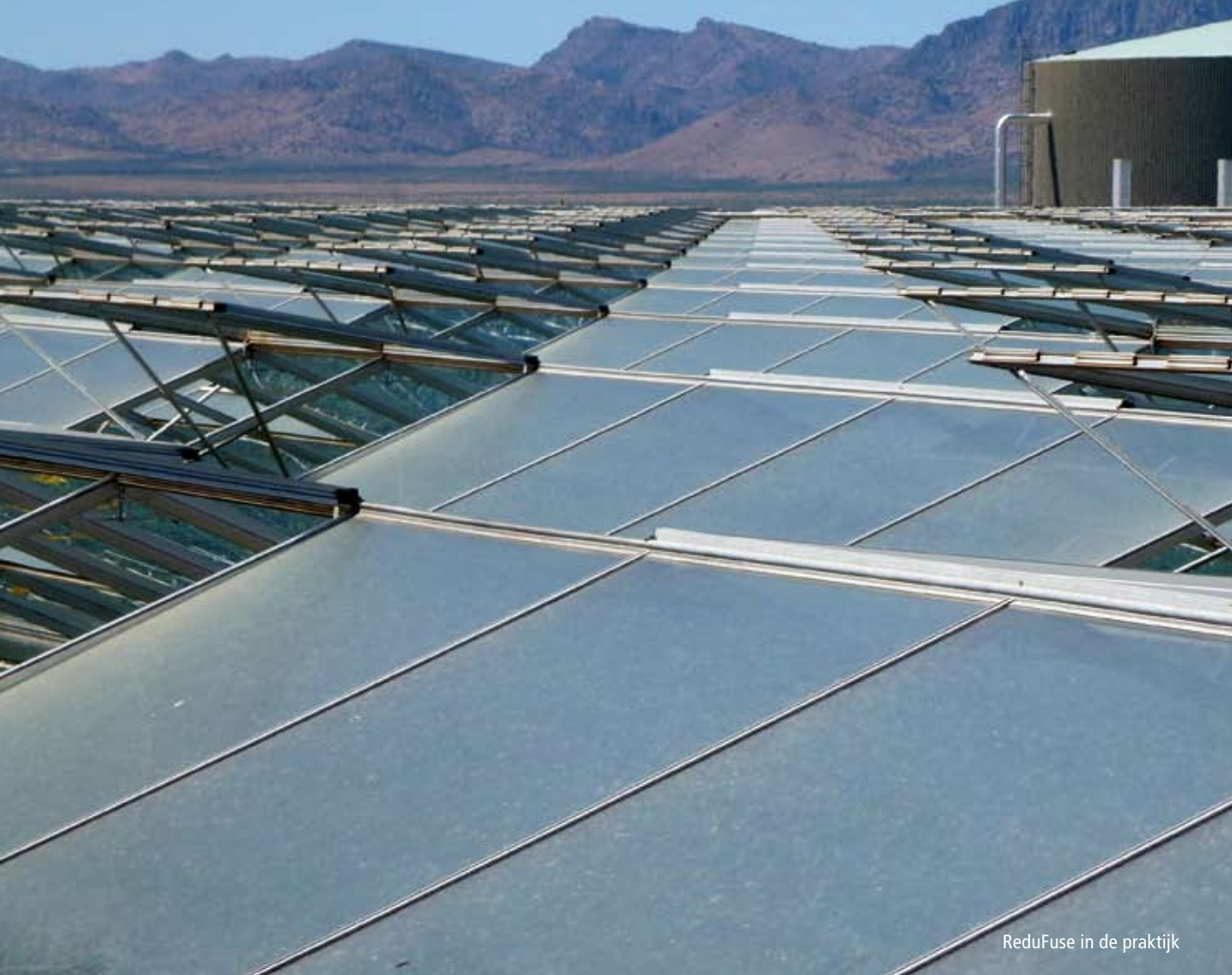
ReduFuse in de praktijk